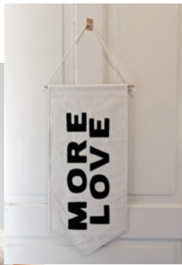
Starke Frauen, starke Sprüche: T-Shirts, Banner.