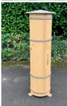
Naturhilfe: Beehome (o.) und Bienenbaum (u.).

Naturkino pur ist ein Beehome (o.). Ordern, aufhängen, kommt mit 25 Mauerbienenkokons. Idee und Infos: Das 2013 gegründete Start-up wildbieneundpartner.ch . Etwas für ganze Bienenstämme baut Willi Herzog, Paddelmacher vom Zürichsee. Der Swiss Tree (l.) simuliert einen hohlen Baum, in dem sich ein Volk ansiedeln kann. Ein seitliches Tor gibt plexiglasgeschützt den Blick auf die Bienen frei, toll für Beobachtungen und artgerechte Honigentnahme. nova-ruder.ch/bienenbaeume